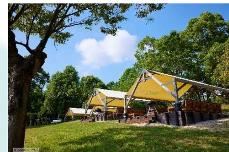
★テラスサイト +5,000円/1サイト(10名まで)