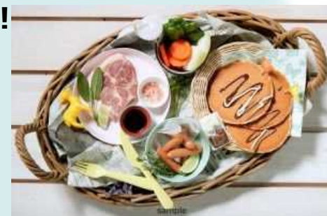
★キッズBBQプラン 2,000円/1人前