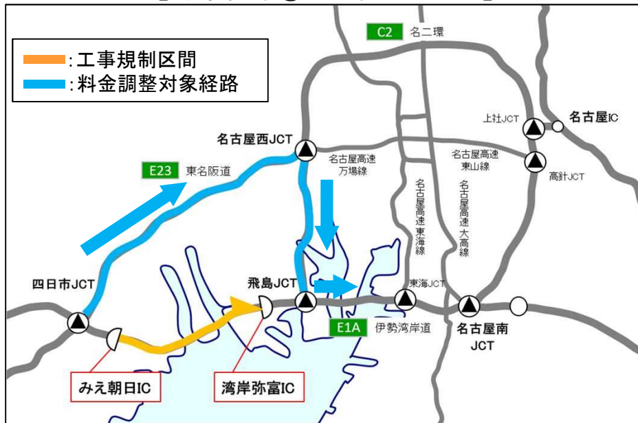
【対象経路①の迂回ルート図】