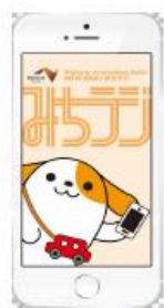
図-1 画面イメージ(アプリ起動時)