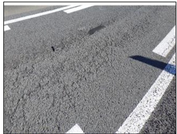
【袋井 IC(下り)ランプ損傷状況】