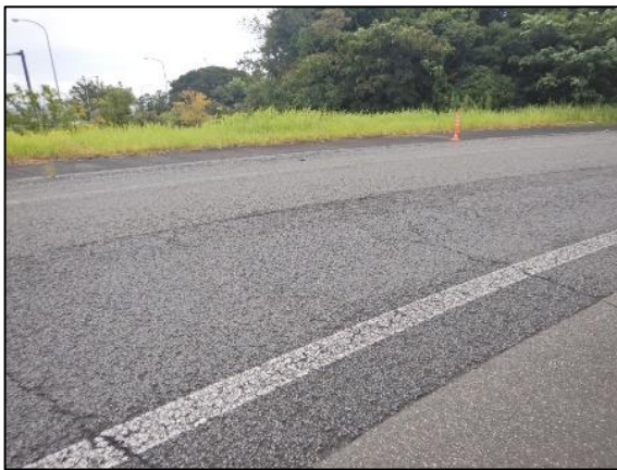
【袋井 IC(上り)ランプ損傷状況】