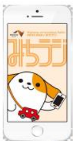
図-1 画面イメージ(アプリ起動時)