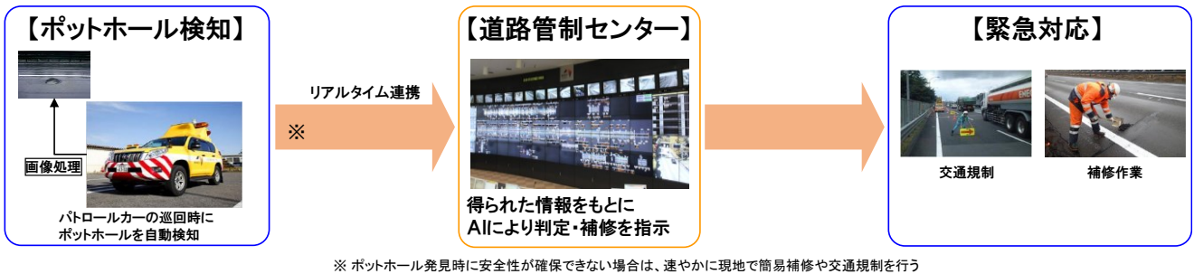
図 2 現在と今後のポットホール検知から補修までの流れ