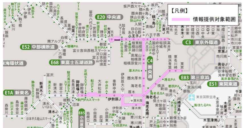
図3 情報提供対象範囲