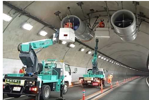
＜トンネル換気設備の点検状況＞