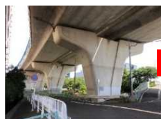
【橋梁における耐震補強工事の施工例】

※既存道路の拡幅かつ災害時に土砂崩れやのり面崩落が発生する危険性がある地域での工事等、4車線化を行うことで道路閉塞のリスクを低減することにつながるものに限る