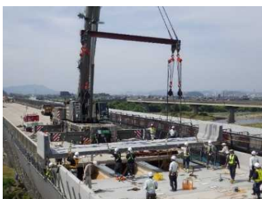
【床版取替工事の様子】