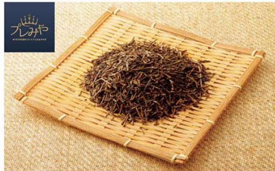
金沢ほうじ棒茶 松乃棒

茶の部分を焙じた「棒茶」は金沢が発祥の地と言われており、石川県で愛飲されています。「石川県ふるさと食品認証制度」の認証基準認定品目の一つである「棒茶」は、味・品質にこだわった少し濃いめで飲みごたえのしっかりした深い味わいのお茶です。舌かな香りも存分に楽しんでいただけます。