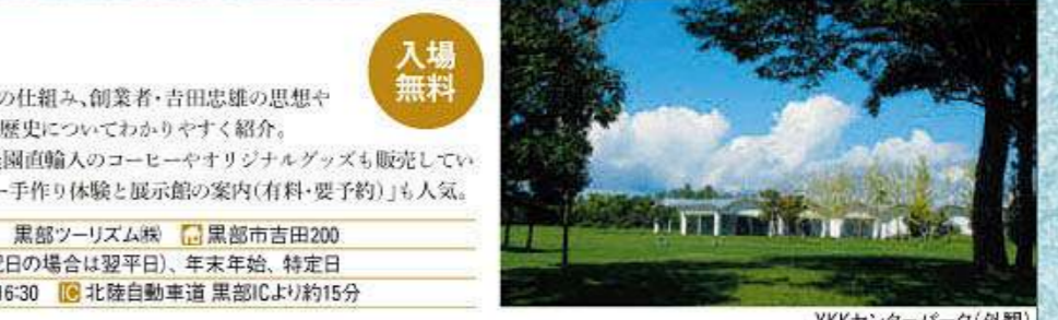
YKKセンターパーク(外観)

☎ 0765-54-8181 黒部ツーリズム株 📍 黒部市吉田200 🕒 休館日 月曜日(祝日の場合は翌平日)、年末年始、特定日 🕒 開館時間 9:00~16:30 🚗 北陸自動車道 黒部ICより約15分