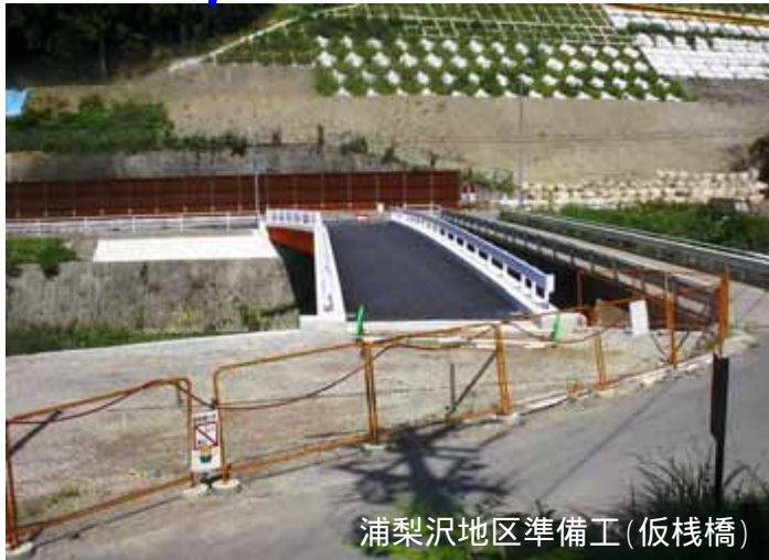
浦梨沢地区準備工(仮栈橋)