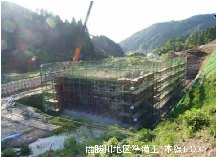
鹿勝川地区準備工(本線BOX)