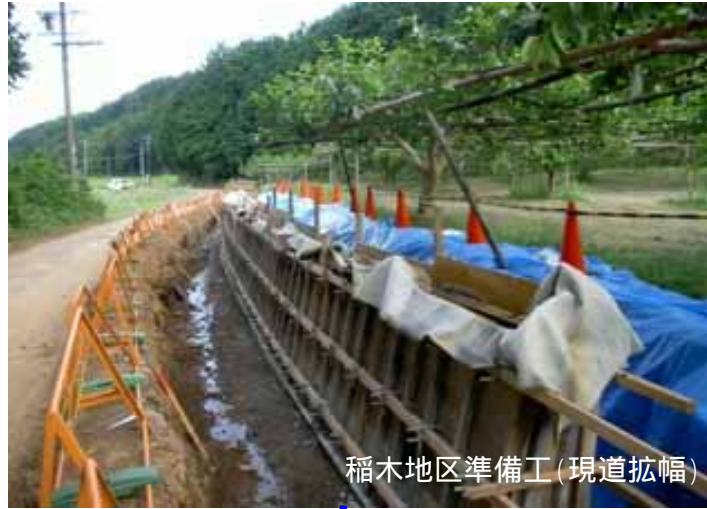
稲木地区準備工(現道拡幅)