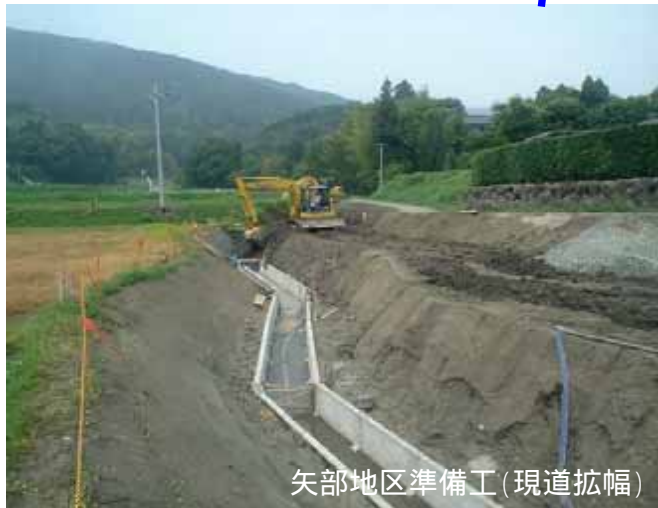
矢部地区準備工(現道拡幅)