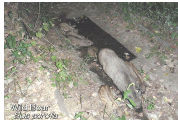
Wild Boar Sus scrofa