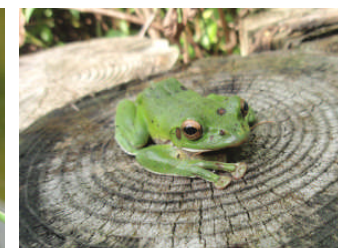
希少種である モリアオガエル