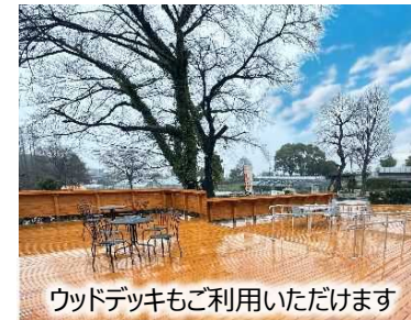
ウッドデッキもご利用いただけます