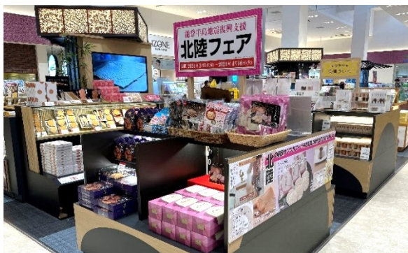
E23 東名阪道 EXPASA御在所 (下り)

北陸土産 特設販売コーナーを展開しています (一部店舗では売上金の一部を支援団体に寄付しています)