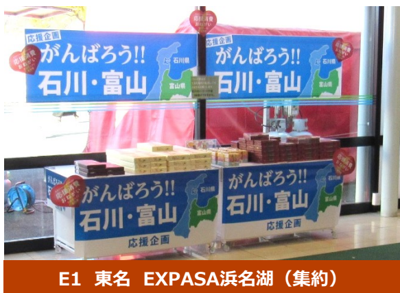
E1 東名 EXPASA浜名湖 (集約)