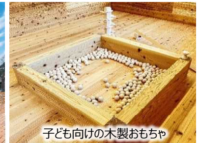
子ども向けの木製おもちゃ