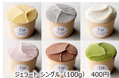
ジェラート シングル (100g) 400円

今後、名古屋コーチンのトッピングなど地元食材をふんだんに使用したメニューや農業センター産の野菜もサラダなどに使用する予定です。