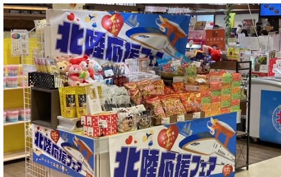
E1A 新東名 NEOPASA岡崎 (集約)