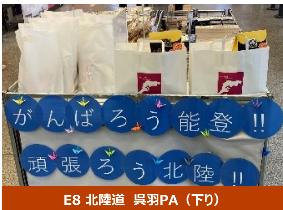
E8 北陸道 呉羽PA (下り)