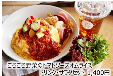
ごろごろ野菜のトマトソースオムライス ドリンク・サラダセット 1,400円