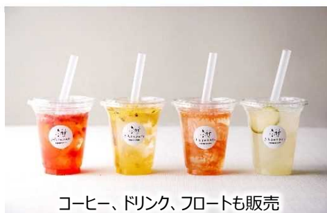
コーヒー、ドリンク、フロートも販売