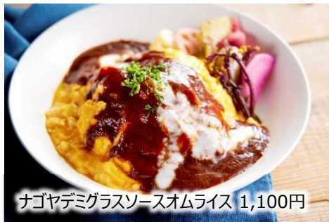
ナゴヤデミグラスソースオムライス 1,100円