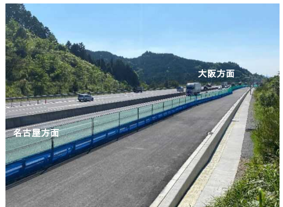
土山 SA 付近の工事状況 (2022年5月)