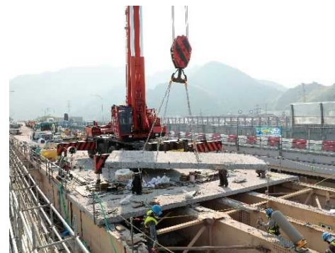
老朽化した床版の撤去の様子