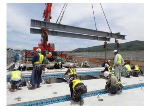
新しい床版パネルの設置の様子