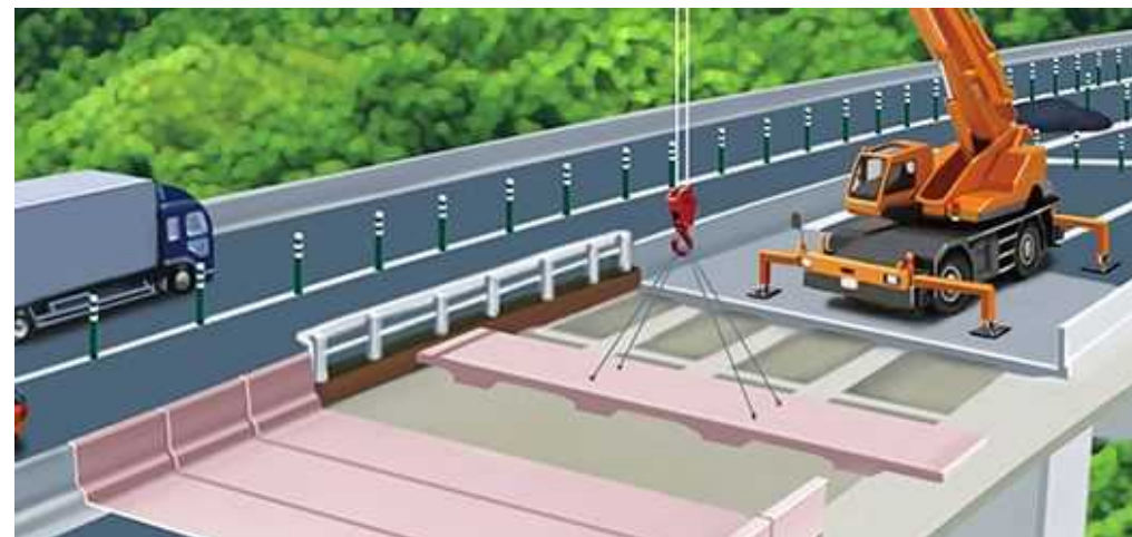
老朽化した床版を撤去し、新しい床版パネルをクレーンで1枚ずつ設置していきます。