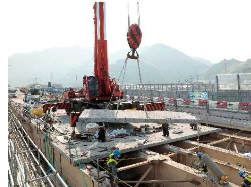
老朽化した床版の撤去の様子