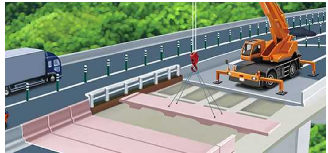
老朽化した床版を撤去し、新しい床版パネルをクレーンで1枚ずつ設置していきます。