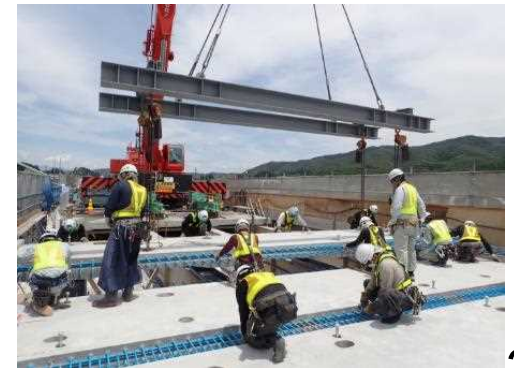
新しい床版パネルの設置の様子