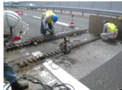
橋梁の伸縮装置取替状況