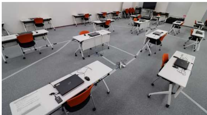
サテライトオフィスを設置(増設)