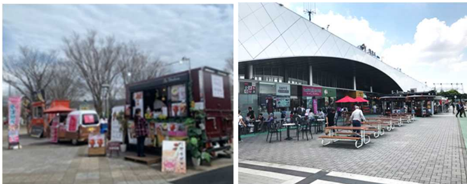
屋外での飲食の提供、飲食スペースの充実 ※「3密」を避け換気の良い屋外での飲食の提供やスペースの拡充