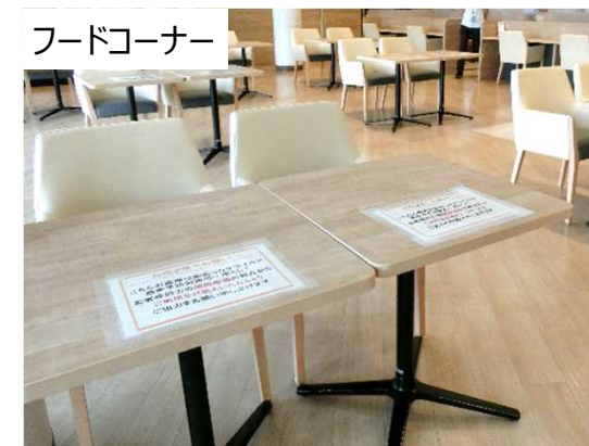
横並びの座席配置