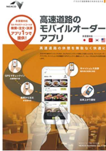
モバイルオーダーシステムの一部導入(予定) ※ モバイルオーダーシステムを導入し、お客さまがセルフで注文とキャッシュレス決済を実施