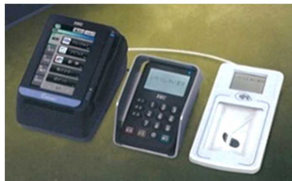
QRコード決済の導入 ※レジにおける現金の取り扱いを極力少なくするため、QRコード決済方法を導入(ショッピングコーナーで全面導入)