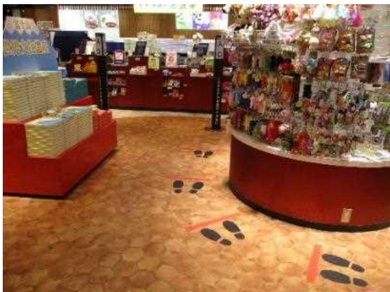
レジ待ち位置の表示 (ショッピングコーナー)