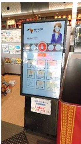
AIを活用したコンシェルジュの一部導入(予定) ※ 大型ディスプレイを使った施設などの音声案内