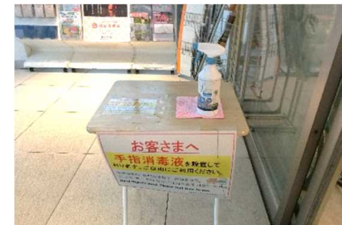
手指消毒液の設置(各出入口)