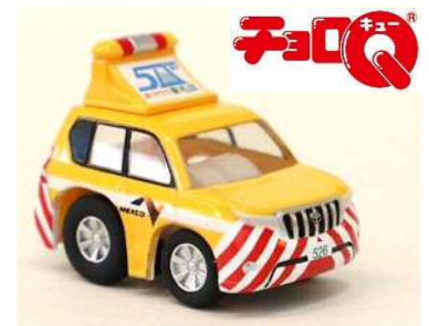
プレゼントの一例 (東名 50 周年 オリジナルチョロQ © TOMY)

※ プレゼント品は十分な数をご用意いたしますが、万一品切れの際は、 なくなり次第終了させていただきます。