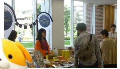
【イメージ】観光・物産 PR

E1 東名のサービスエリアや沿線自治体が、 観光 PR や地域の名物・名産品のご紹介・販売をおこないます。 NEXCO 中日本のオリジナルキャラクター「みちまるくん」や沿線自治体のご当地キャラクターも登場してご来場の皆さまをお迎えします。