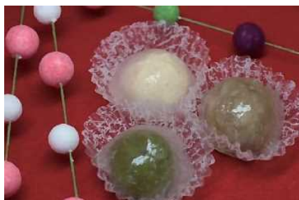
和菓子「からくり姫団子」

・福井大学と連携し、学生の提案により「自治体のご当地キャラとコラボしたイベント」を実施