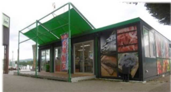
地元特産品の生鮮マルシェの展開 東名 足柄SA (上り)

地元企業の誘致や地元事業者との商談会を通じた地域特産品コーナーの充実に加え、沿線自治体などと連携したイベントを開催し、地域の魅力を発信するサービスエリアづくりを実施