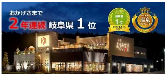
温浴施設 (よりみち温泉)

東海環状道 土岐南多治見インターチェンジ横で、東濃地域の観光の拠点として、複合商業施設「テラスゲート土岐」を運営