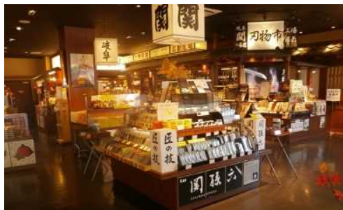
地域の特色を活かした店舗づくり 東海北陸道 関SA (上り)