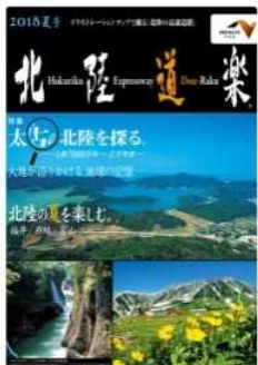
観光冊子「北陸道楽」

「『北陸』地域で高速道路などの『道』を利用して、気楽に観光地巡りを『楽』しんでいただきたい」という願いから生まれたガイドブックを発行。「日本タウン誌・フリーペーパー大賞2018」審査員特別賞と観光部門優秀賞を受賞