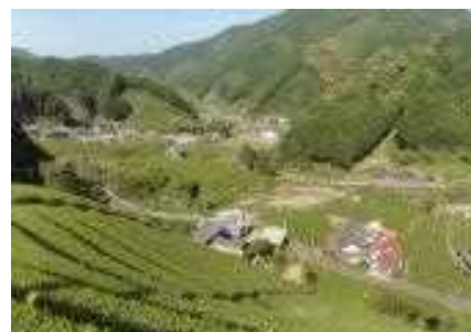
お茶畑や山林の景観の維持・向上 水見色地区 (静岡市)

「地域連携の強化、地域社会・経済への貢献」をさらに進めるため、高速道路空間外へCSR活動範囲を拡大し、高速道路沿線で、社員によるボランティア活動を実施