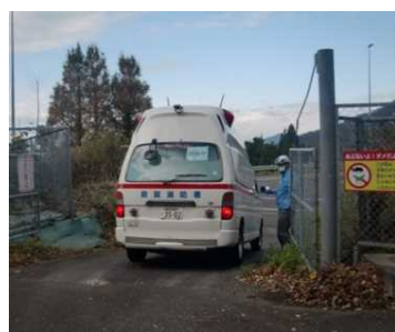
開口部からの 高速道路流入状況