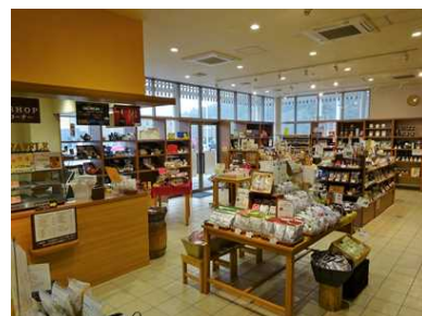
地元特産品販売 (まちゆい)