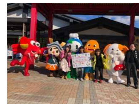
自治体のご当地キャラとコラボしたイベント（北陸道 南条SA）