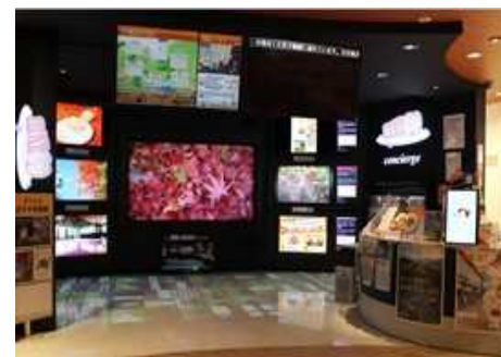
DAN-GOツーリストガイド

・山梨県と連携し、中央道 談合坂SA（下り）の観光情報提供施設（DAN-GOツーリストガイド）で観光情報を発信 ・やまなし観光推進機構と連携し、中央道 双葉SA（下り）の一部スペースを活用して観光をPR