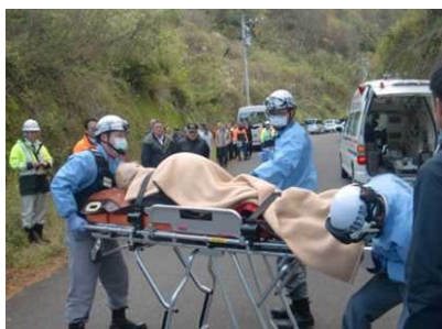
急病人搬送訓練状況