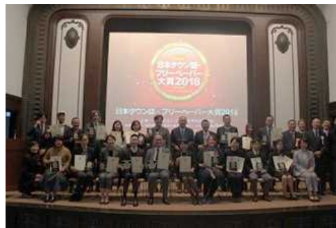
フリーペーパー大賞2018授賞式