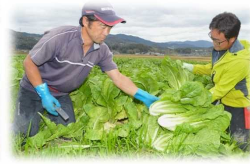
レタスの収穫 (浜松市)