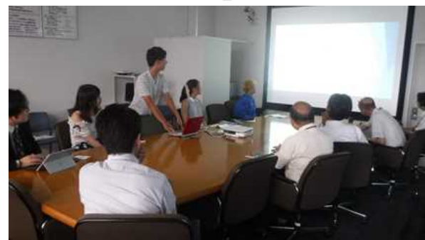
学生との企画検討の様子