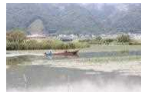
三方五湖およびその周辺の自然環境保全 三方五湖 (福井県若狭町)