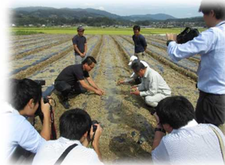
中日本ファームすずなり(株)作付け式

農業従事者の高齢化、次世代の担い手不足および耕作放棄地の増加などの地域の課題を解決するために実施していた地域連携活動から発展し、法人化