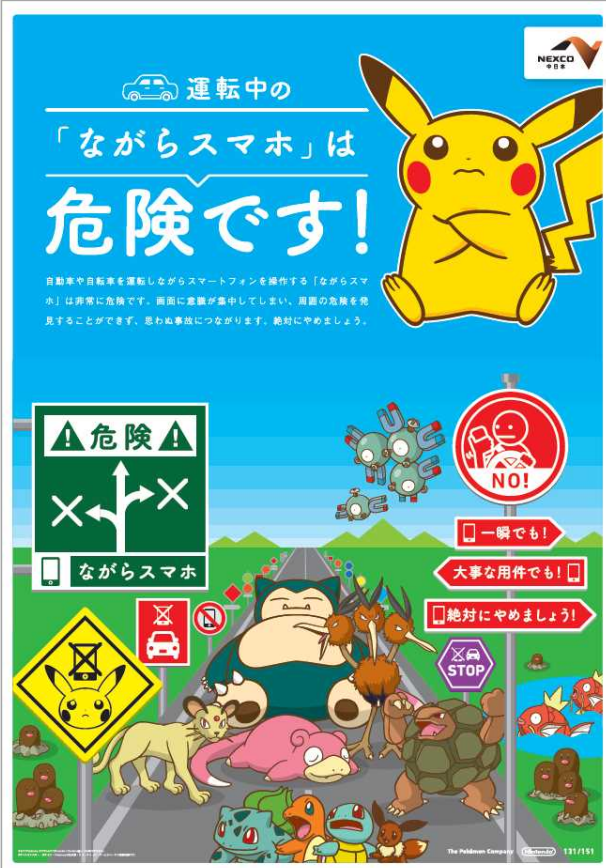
(株)ポケモンとの共同実施による「ながらスマホ」防止ポスター

危険な運転者に追従されるなどした場合は、サービスエリアなど近くの安全な場所に待避するとともに、警察に110番で通報してください。