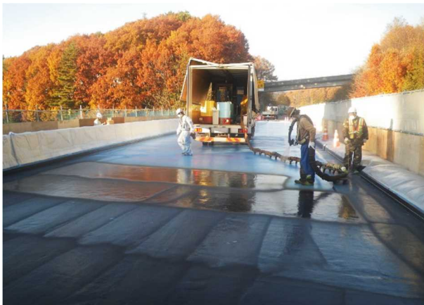
橋の床版取替え工事(防水工施工)