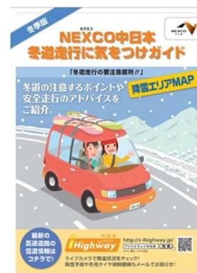
《冬道走行に気をつけガイド》