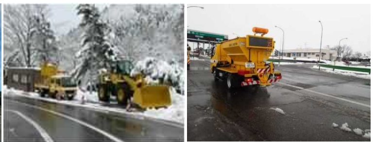
《救援車両事前配備(過年度の事例)》 《小型散布車》