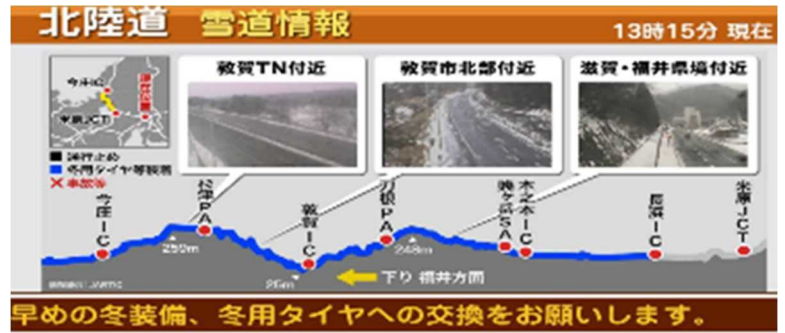
《休憩施設におけるリアルタイム映像の提供(過年度の事例)》