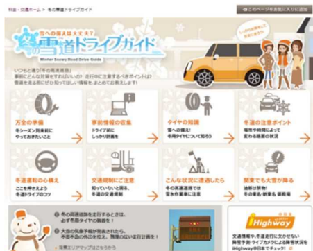
《雪道ドライブガイド(公式WEBサイト)》