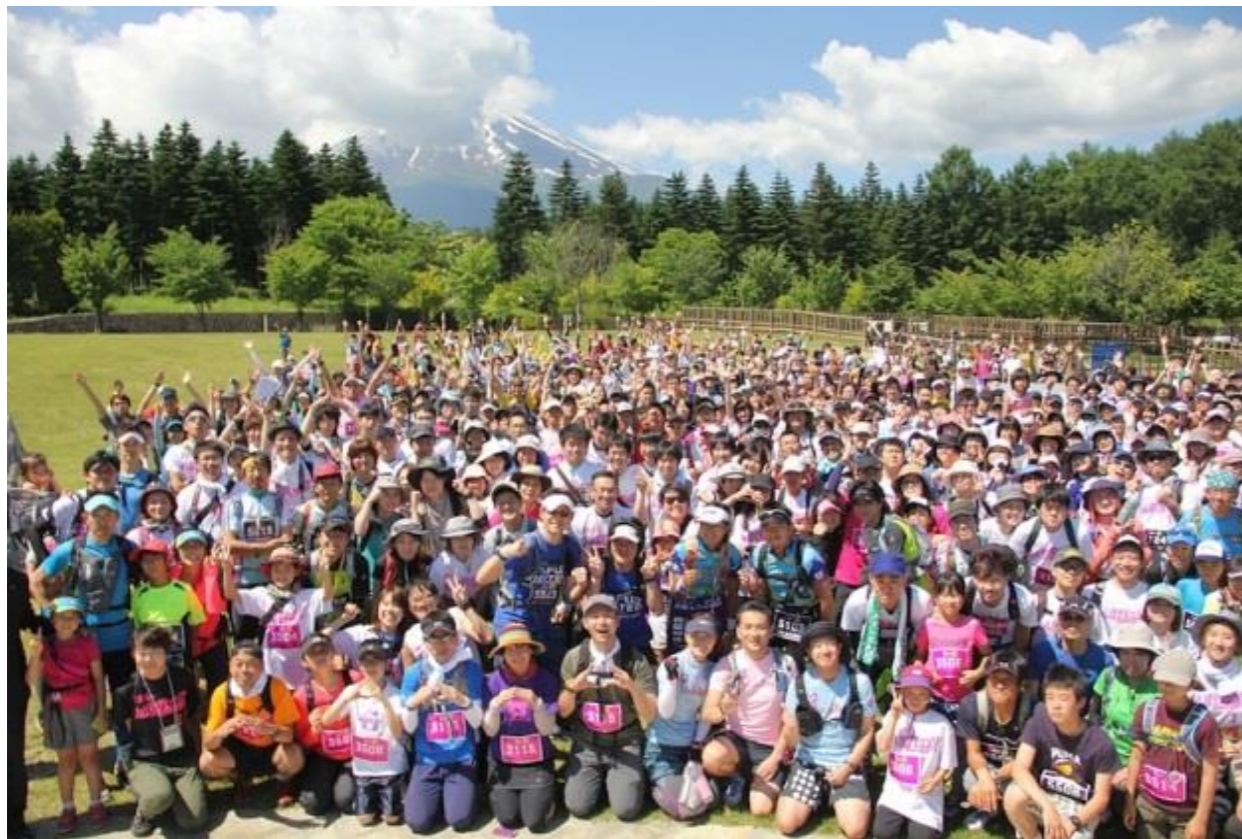
富士吉田大会(2014年6月15日) スタート前集合写真

また参加者からは、『また改めてじっくりと観光に来たい』との声を多数いただいています。