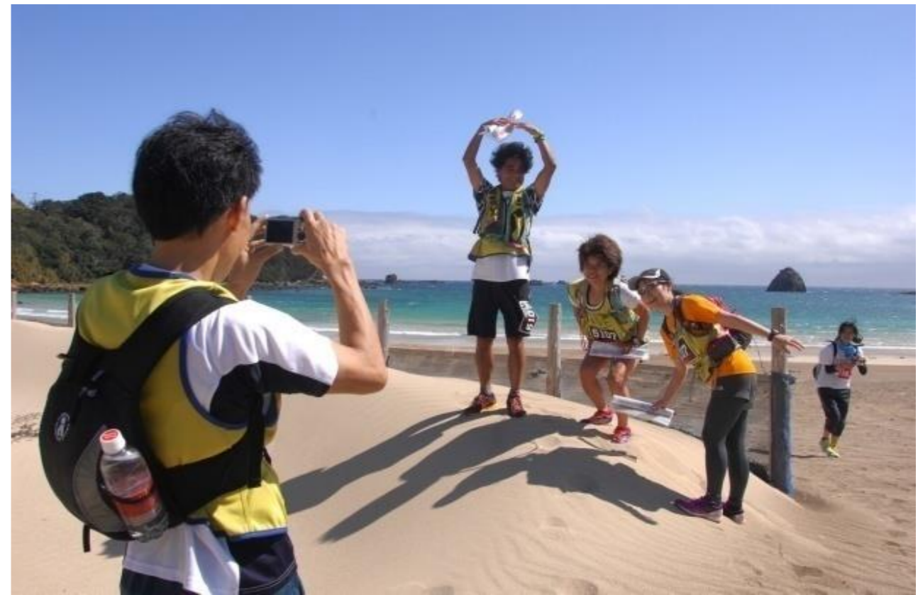
伊豆下田大会(2013年10月6日) チェックポイント「筆島」を入れて撮影