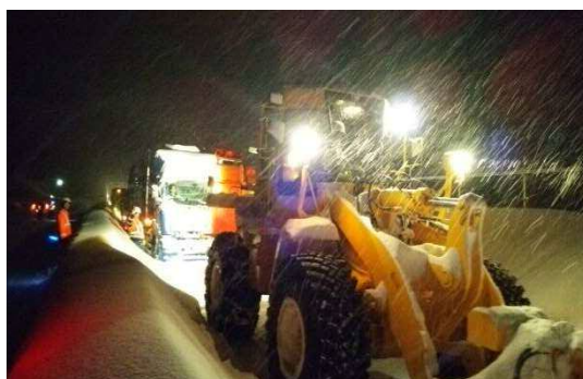
立ち往生した車両のけん引作業