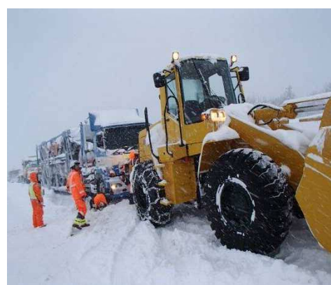
立ち往生した車両のけん引作業