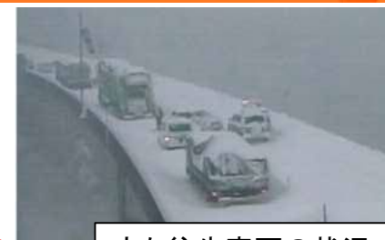
立ち往生車両の状況