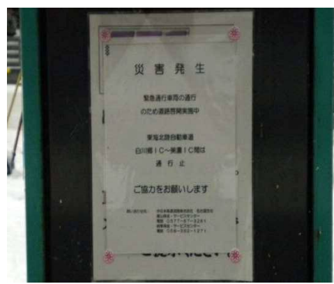
改正災対法指定道路の周知 (災対法第76条の6第1項)