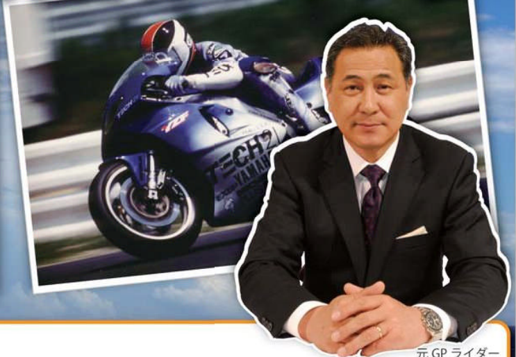
元 GP ライダー 平 忠彦氏