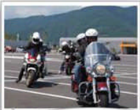
いってらっしゃい！

清水 PA( 出発 ) ...> 新東名 ...> 西伊豆スカイライン ...> 駿河湾フェリー ...> 清水港 ...> 清水 PA ( 解散 )