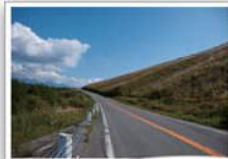
是非ワインディングを 楽しんで！