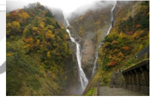
D : 称名滝 (富山県)