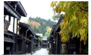
F : 高山 (岐阜県)