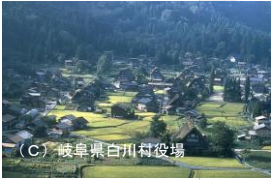
(C) 岐阜県白川村役場