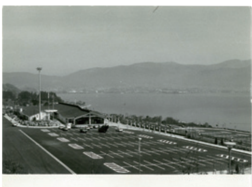
開通当初の諏訪湖SA