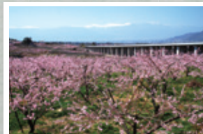
2011春【最優秀賞】桃の里