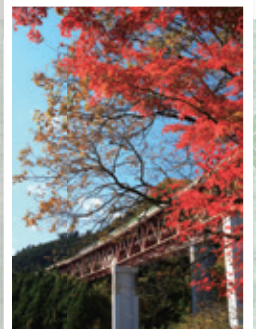
2011秋【最優秀賞】谷間の秋