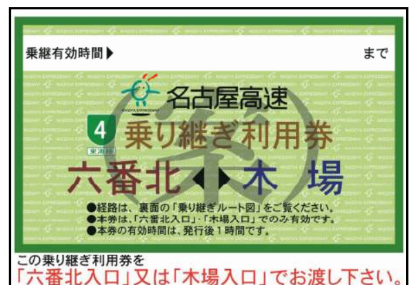
図2 乗り継ぎ利用券イメージ (大きさはA4二つ折りのA5)