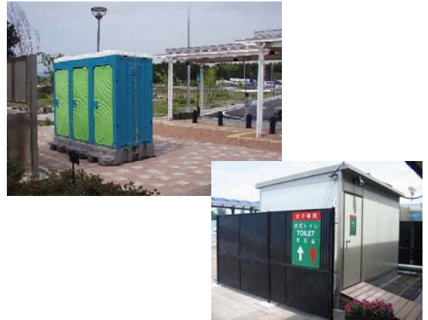
仮設トイレの設置