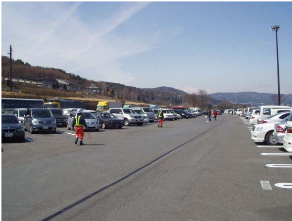
駐車場整理員の配置