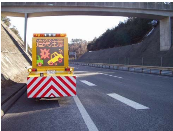
渋滞後尾への追突注意喚起対策