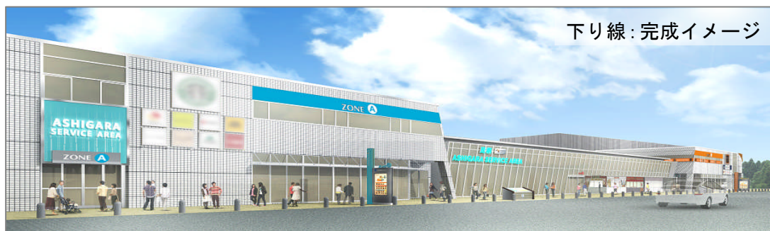
下り線：完成イメージ