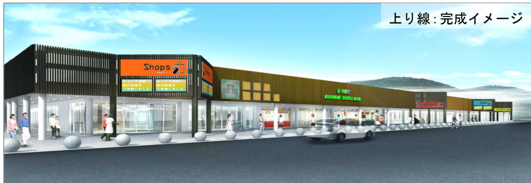
上り線：完成イメージ

EXPASA足柄は、富士山を望むテラス席や金時山の景観を楽しむ入浴施設など景観・周辺環境を一層活用し、ドッグカフェといったペットとの共生社会へ対応するなど新しい業態に取り組んだ、今までにないエリアへと生まれ変わります。