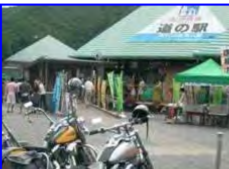
「道の駅 紀伊長島マンボウ」入込客及び売上対前年比の推移