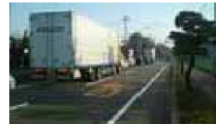
県道小松加賀線の渋滞状況