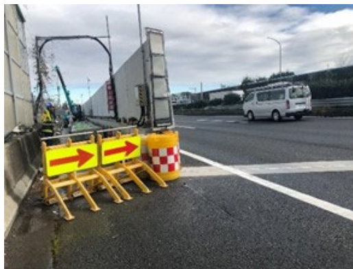
緩衝装置などの設置例