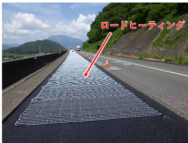
ロードヒーティングの設置状況(イメージ)

園原 IC ランプ橋において、融雪のために舗装内部に設置されているロードヒーティング(電熱線)を補修します。