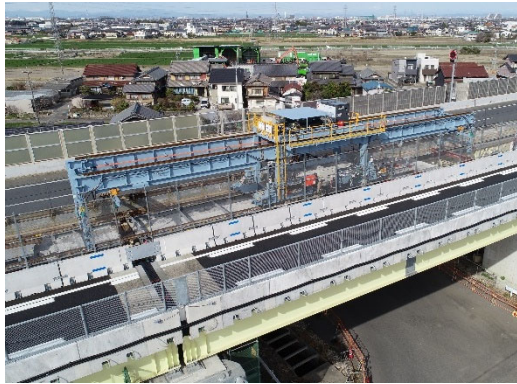
撤去する床版架設機

東名阪道リニューアル工事において、側道に据えたクレーンにて追越車線上での床版取替工事に使用していた床版架設機を撤去します。