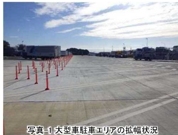
写真-1 大型車駐車エリアの拡幅状況