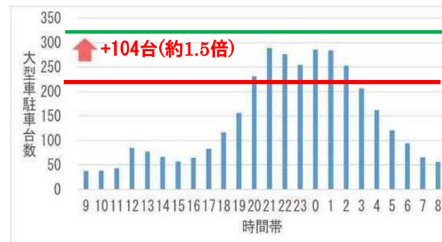
図-2 時間帯別大型車駐車状況(平日) 牧之原SA(上り)