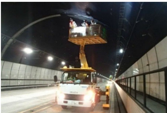
トンネル覆工点検(イメージ)