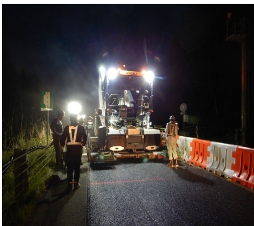
舗装補修工事(イメージ)