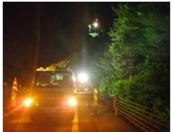
樹木剪定作業(イメージ)