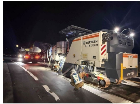
舗装工事イメージ