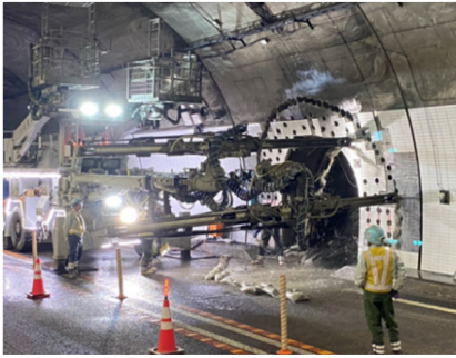
避難連絡坑拡幅工事