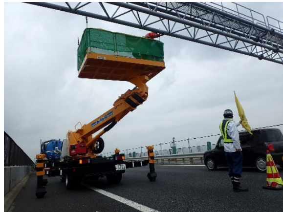
標識の点検状況(イメージ)