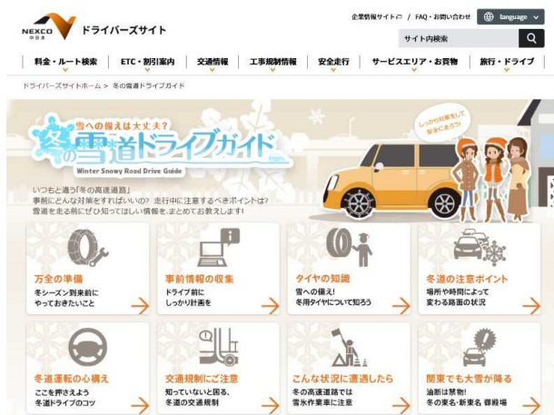
【WEB サイト 冬の雪道ドライブガイド】

冬道の注意するポイントや安全に走行いただくための情報は、当社公式WEBサイト内の「冬の雪道ドライブガイド」[ https://www.c-nexco.co.jp/special/snow/ ]でご確認いただけるほか、SA・PAにてお配りしているリーフレット「NEXCO 中日本 冬道走行に気をつけガイド」でもご紹介しています。