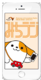
図-1 画面イメージ(アプリ起動時)