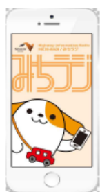
図-1 画面イメージ (アプリ起動時)

https://www.c-nexco.co.jp/jam/michiradi/