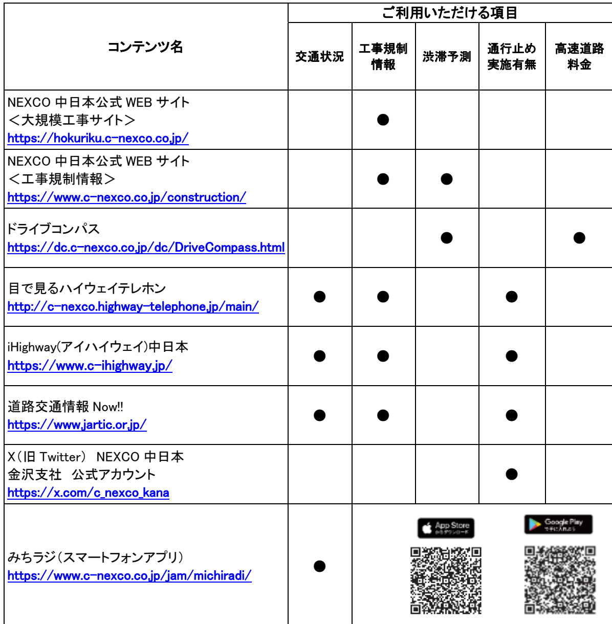
道路交通情報や工事に関する情報の確認方法一覧

なお、自動車運転中のドライバーの携帯電話の使用は法律で禁止されています。携帯電話をご利用の際はSA・PA をお願いいたします。