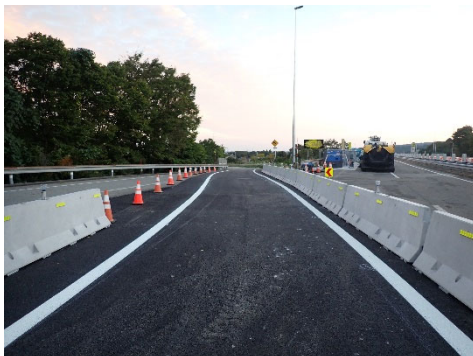
設置している仮設ランプ

橋梁の床版取替工事に伴い設置した仮設ランプを撤去するための舗装工事などを実施します。