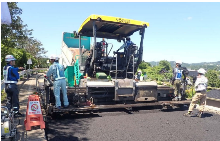
舗装補修工事のイメージ