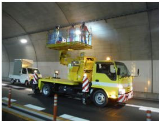
<トンネル照明設備点検>