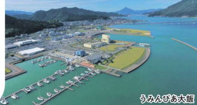
うまんびあ大飯店

舞鶴若狭自動車道は おかげさまで 全線開通10周年を迎えます。 兵庫・京都・福井を結ぶ大動脈として これまでもこれからも 地域の皆さまの豊かな暮らしのために 人と経済と文化の未来を つないでいきます。