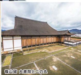
篠山城 大書院と二の丸