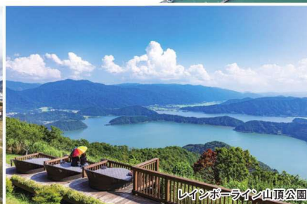
レインボーライン山頂公園