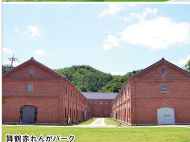
舞鶴赤レンガパーク