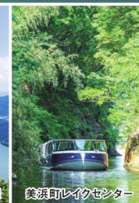
美浜町レイクセンター