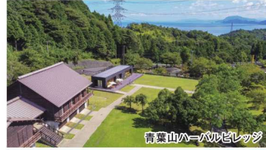
青葉山ハーバルビレッジ