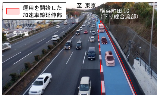
<横浜町田IC（下り線）加速車線延伸（2022.11）>