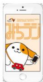
図-1 画面イメージ(アプリ起動時)

https://www.c-nexco.co.jp/corporate/pressroom/news_release/5364.html